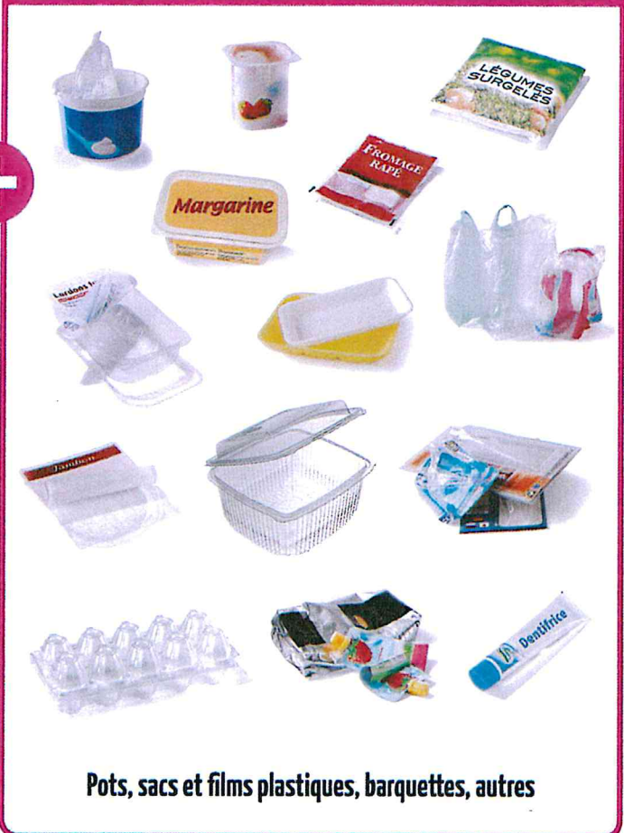
Pots, sacs et films plastiques, barquettes, autres