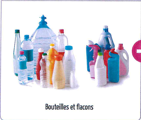
Bouteilles et flacons