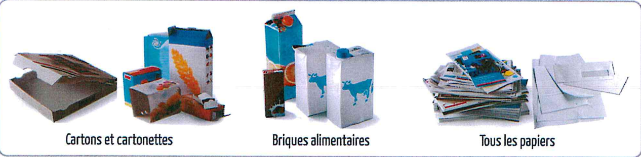
Cartons et cartonnettes